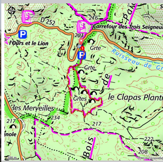
L'ours et le Lion (B.Zimmerman)

Enchanteur, le Bois de Païolive est une des plus étranges curiosités d'Ardèche. Forêt ancienne constituée de chênes à l'exceptionnelle valeur patrimoniale de naturalité et de biodiversité, ce bois est un véritable labyrinthe naturel.